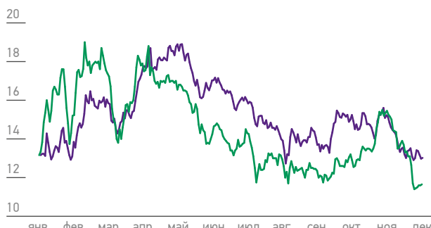
ДИНАМИКА ГДР МЕГАФОНА В 2015 ГОДУ, (долл. США)