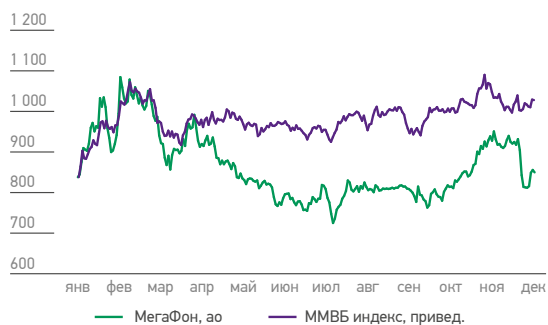
ДИНАМИКА ОБЫКНОВЕННЫХ АКЦИЙ МЕГАФОНА В 2015 ГОДУ, (руб.)